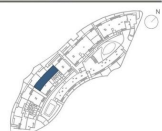
CUADRO DE SUPERFICIES