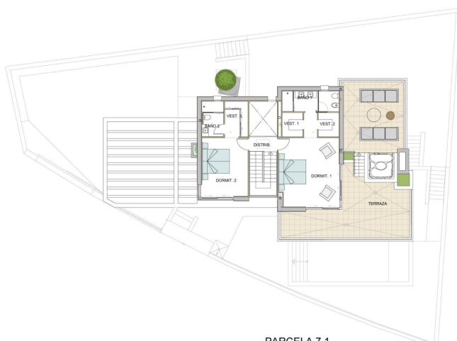
PARCELA 7.1 PLANTA ALTA - DISTRIBUCIÓN