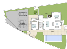
PARCELA 7.1 PLANTA BAJA - DISTRIBUCIÓN