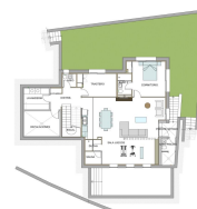
PARCELA 7.1 PLANTA SOTANO - DISTRIBUCIÓN