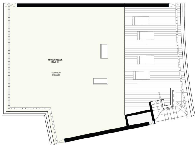
VT0055 3 dormitorios (Solarium) Planta 2-Portal 4-Letra A

Este documento es un extracto de la información de carácter técnico que se encuentra en el expediente de la obra. No se garantiza la exactitud de los datos ni la vigencia de la información. El cliente debe verificar la información antes de tomar cualquier decisión. El responsable de la información es el arquitecto de la obra.