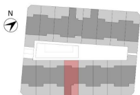
VIVIENDA P. PRIMERA 2 DORMITORIOS