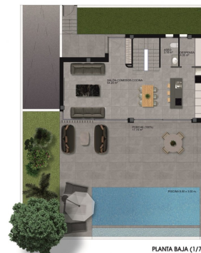
PLANTA BAJA (1/75)

PARCELA 05 271.00 m 2 SUPERFICIE CONSTRUIDA SÓTANO 180.50 m 2 SUPERFICIE CONSTRUIDA PLANTA BAJA 80.90 m 2 SUPERFICIE CONSTRUIDA PLANTA PISO 45.50 m 2 SUPERFICIE CONSTRUIDA TOTAL 306.90 m 2 SUPERFICIE CONSTRUIDA TOTAL COMPUTABLE 208.80 m 2