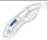
CUADRO DE SUPERFICIES