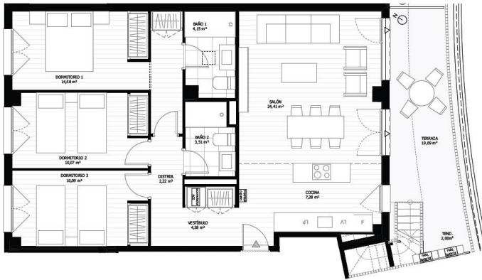
VT0055 3 dormitorios Planta 1-Portal 6-Letra A

*Este documento es un modelo de contrato de compraventa de vivienda. El comprador debe leer detenidamente el presente documento y verificar que el precio de venta coincide con el precio de venta que aparece en el anuncio de la Zona. El vendedor no se responsabiliza de la veracidad de los datos que aparecen en este documento. El comprador debe leer detenidamente el presente documento y verificar que el precio de venta coincide con el precio de venta que aparece en el anuncio de la Zona. El vendedor no se responsabiliza de la veracidad de los datos que aparecen en este documento.