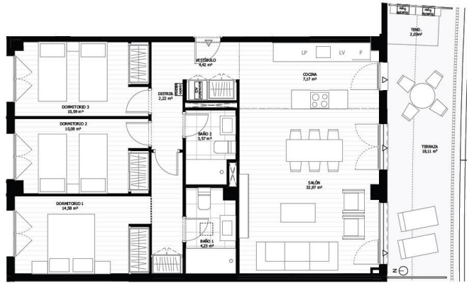
VT0072 3 dormitorios Planta 1-Portal 9-Letra B