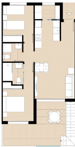
Second Floor/ Planta Segunda (E:1/100)